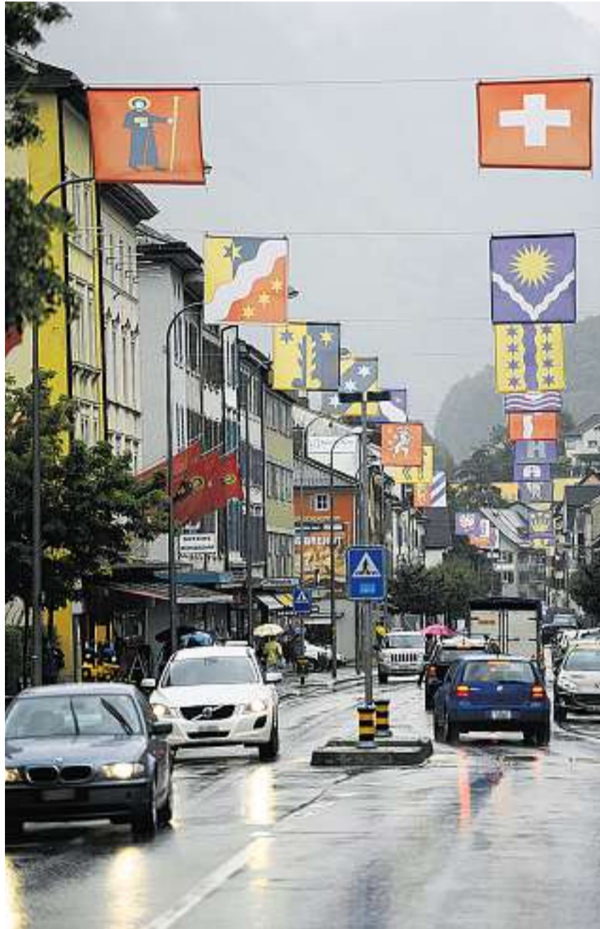
Aus vielen mach drei: Das Fusionsresultat ist in den drei Gemeinden recht ähnlich – der Weg dahin aber unterschiedlich kostspielig.