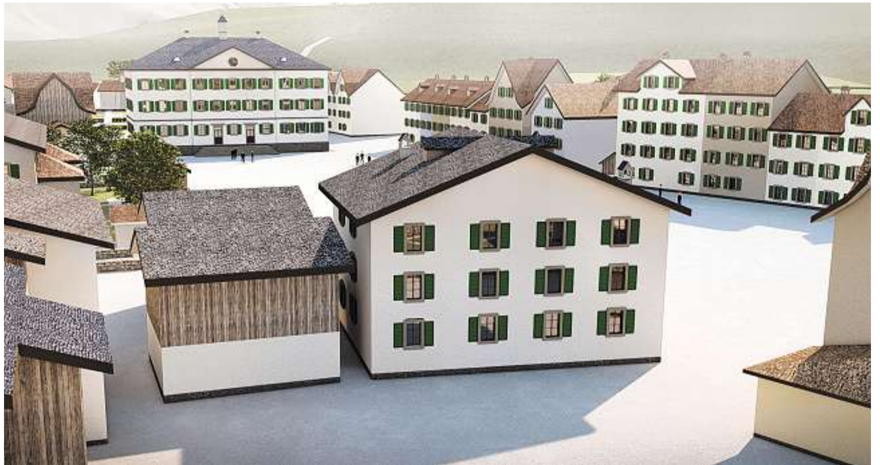
Brandherd: Von den Ställen links im Vordergrund geht am 10. Mai 1861 der Brand von Glarus aus.